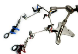
アーム数2本 PV-220W PV-300W