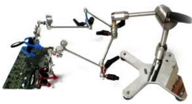
水平設置基板 測定例

1. フレキシブルなアームにより、様々な状態で設置された基板に対して迅速に安定したプロービングを行えます。