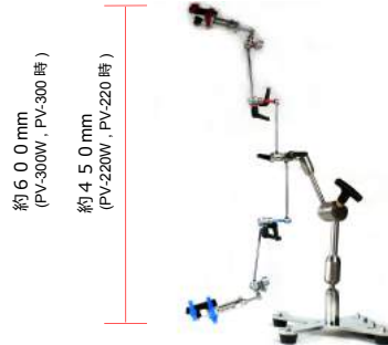
約600mm (PV-300W, PV-300時) 約450mm (PV-220W, PV-220時)