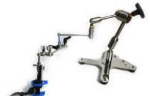
アーム数1本 PV-220 PV-300