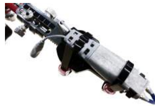
Keysight社 InfiniiMax 装着例