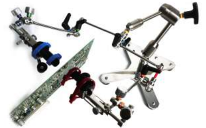
垂直設置基板両面 測定例

2. プローブ装着部は固定バンドを用いた独自の固定方法により、様々なサイズ、形状のプローブを安定して装着できます。又、スプリングを内蔵した独自構造の先端部によるプローブ接触圧発生機構により常に安定したプロービングを実現します。