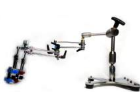
アーム長 約300mm (PV-300W, PV-300時) アーム長 約220mm (PV-220W, PV-220時)

3. コンパクトながらアームを伸ばせば大型の基板にも対応可能です。またC型クランプ（別売）の使用による作業台への直接取付も可能です。