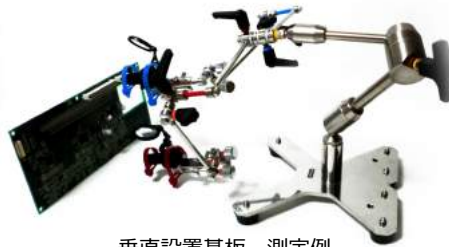
垂直設置基板 測定例