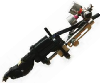
Tektronix社 P7700 装着例

2. プローブ装着部は固定バンドを用いた独自の固定方法により、様々なサイズ、形状のプローブを安定して装着できます。又、スプリングを内蔵した独自構造の先端部によるプローブ接触圧発生機構により常に安定したプロービングを実現します。