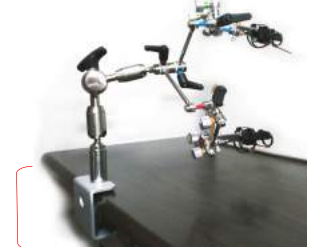
C型クランプオプション (PV-C1) 使用例